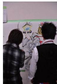
ラクガキコーナーイメージ

プチオンリー配置ホールに対して専用のラクガキコーナーを設置します。 ラクガキコーナーの用紙についてはお持ち帰り頂いても構いません。 右図は実際のラクガキコーナーの様子です。 ※サークルの申し込み状況により、設置できない場合がございます