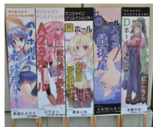
立て看板イメージ

プチオンリー配置のホールの入口に専用の立て看板を設置します。※右図は看板のイメージになります （入口に設置するのは1枚です）